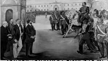
[ب] وحدة الصفا والتسليق المستمر