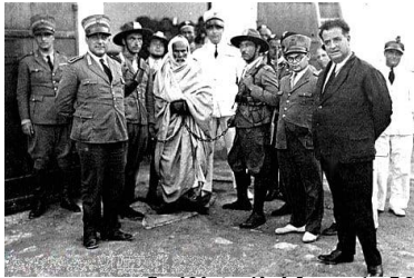
[ب] تحقيق مبدأ المواصه